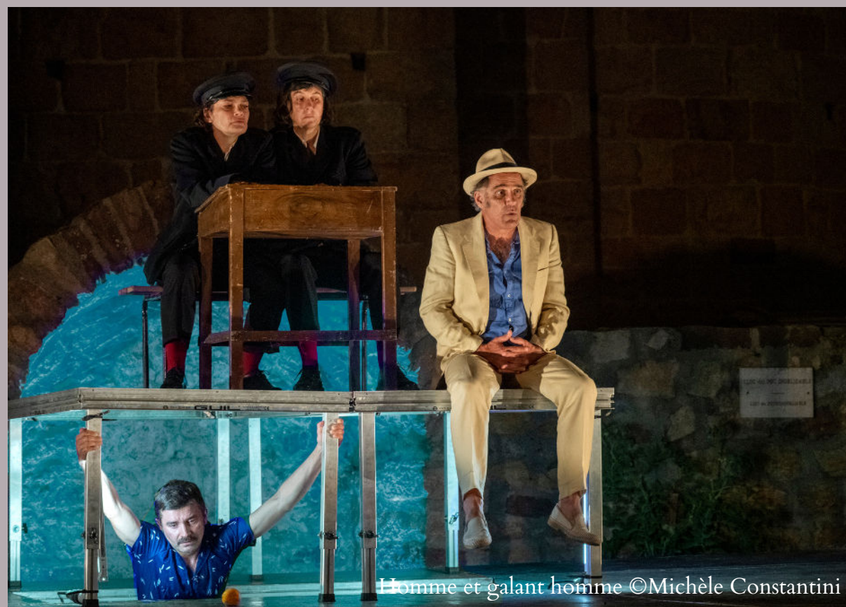
Homme et galant homme

La Bonne âme de Se-Tchouan de B.Brecht sera créée sur la place de l'église Coustouges les 31 juillet et 2 août 2025.