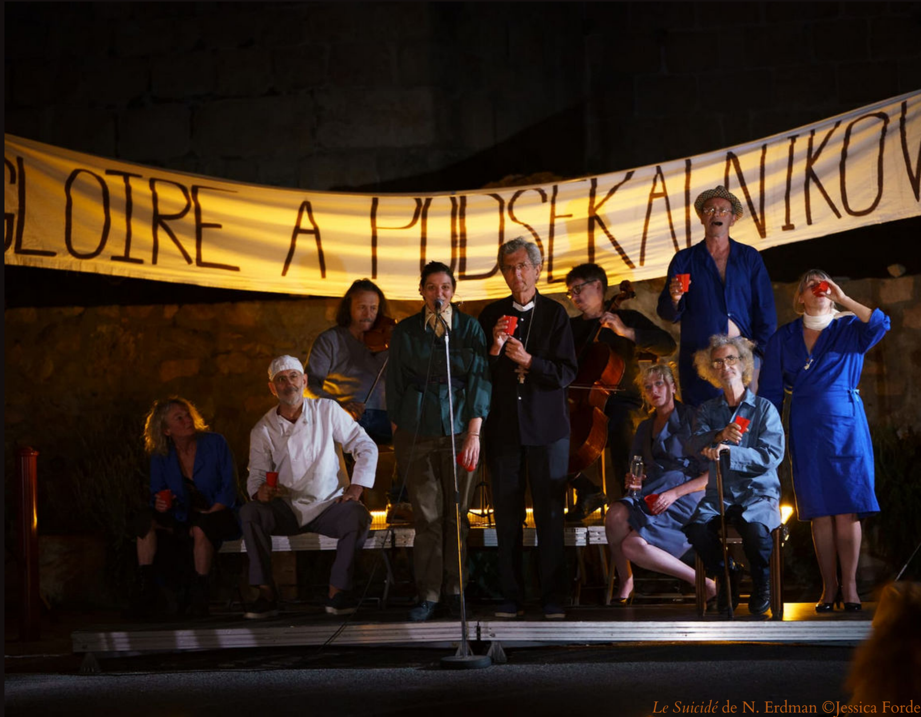
Le Suicidé de N. Erdman

Les artistes de la scène qui participent au festival 543 depuis sa première édition sont des professionnels aux parcours, aux expériences très différentes mais complémentaires. Acteur.trices de théâtre et de cinéma, musicien.nes, auteur.trices, danseur.se-chorégraphe, traducteur.trice, acrobate, l'éventail des compétences réunies et des imaginations à l'œuvre est large.