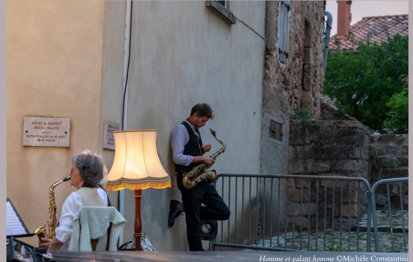
Homme et galant homme

Le festival 543 accueille, depuis l'édition 4, le CIDFF (Centre d'Information sur le Droit des Femmes et des Familles), qui tient un stand d'information et de sensibilisation aux violences sexistes et sexuelles. C'est pour lui l'occasion de soutenir cette association très présente à Perpignan mais encore trop peu dans les zones rurales, comme le Haut Vallespir, sur un sujet qui lui tient particulièrement à cœur.